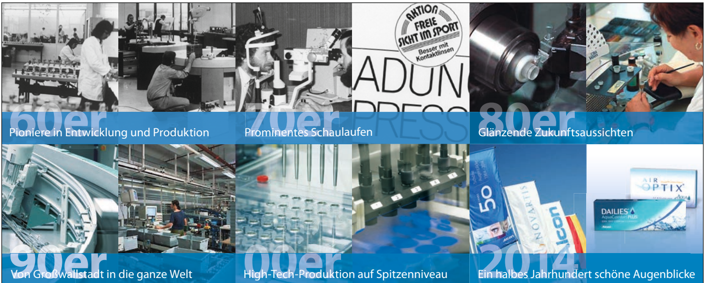
60er Pioniere in Entwicklung und Produktion